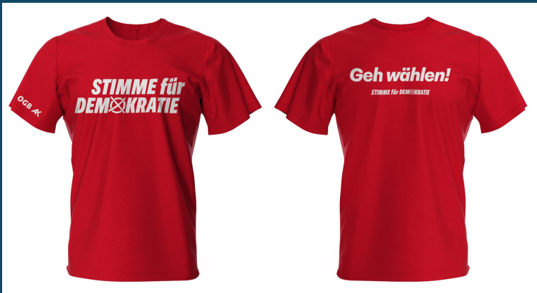
Warnwesten & T-Shirts